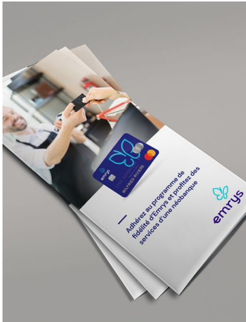
Outil de présentation : les flyers sont disponibles sur la boutique en ligne.

Il faut être membre Enchanteur pour pouvoir parrainer un commerce. Il est interdit à tous les membres Enchanteurs de visiter des commerces inconnus et de les démarcher commercialement en tant que représentant d'Emrys.